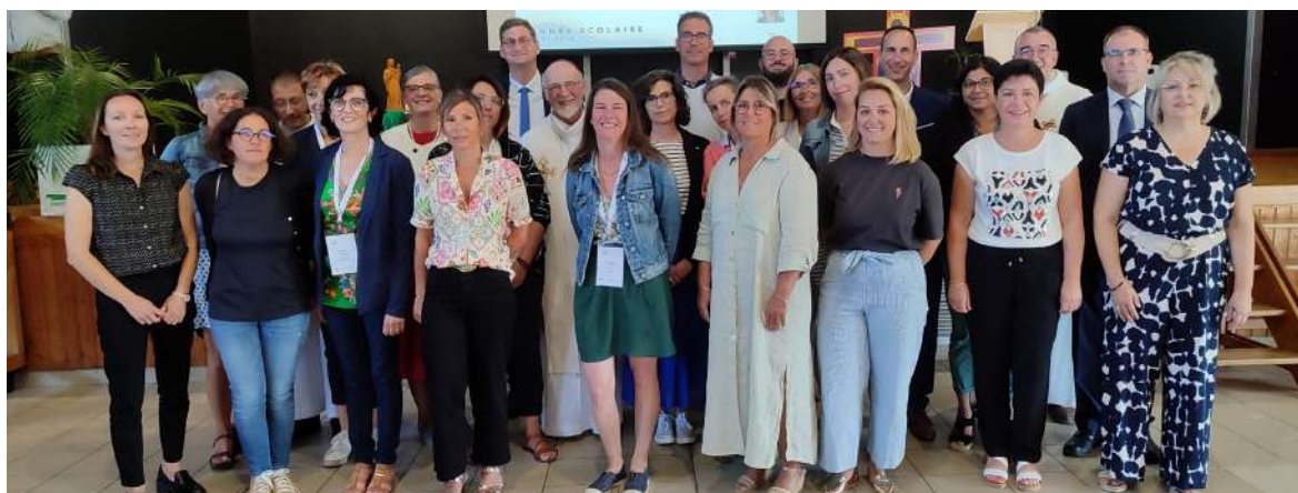
Journée de rentrée institutionnelle du 27 Août